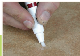
10 Zabezpieczanie powierzchni

Po wypełnieniu, ponownie nadmiar wypełniacza usunąć karbowaną stroną szpachelki. W końcowej fazie płynnymi ruchami wygładzić retuszowane miejsce szerokim, ostrym brzegiem szpachelki. Uwaga: Nie drapać końcówką!