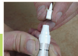
8 Odpowietrzanie korektora

Przed użyciem wstrząsać korektor LAKFIX® przez ok. 15 sekund w celu wymieszania lakieru. Kulki wewnątrz korektora muszą być słyszalne. Po tej czynności ściągnąć nakrętkę.