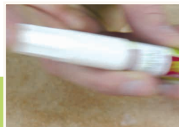
7 Przygotowanie korektora

Wypełniacz nanosić na uszkodzone miejsce za pomocą przyrządu do topienia wypełniaczy. Po każdej czynności nanoszenia, grót przyrządu wyczyścić trykotową ściereczką. Uwaga: niebezpieczeństwo oparzenia.