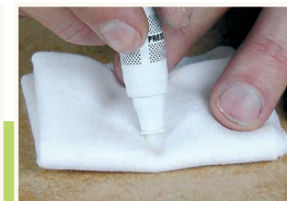
9 Aktywacja korektora

Ściągnąć końcówkę z pędzelkiem – tak jak pokazano na zdjęciu i nacisnąć ostrożnie w miejscu oznaczonym „PRESS”. Uwolnienie ciśnienia z wnętrza korektora spowoduje jego odpowietrzenie. Po tej czynności ponownie nałożyć końcówkę z pędzelkiem.