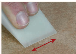
6 Wyrównanie powierzchni

Jeśli nie udało się dobrać odpowiedniego odcienia wypełniacza pasującego do naprawianej powierzchni, można ponownie jeden lub dwa kolory zmieszać ze sobą w miejscu retuszowanym.