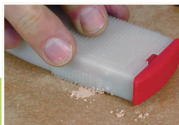
4 Usuwanie nadmiaru

Korektor LAKFIX® przytrzymać nad trykotem w pozycji końcówką w dół, a następnie w miejscu oznaczonym napisem „PRESS” lekko naciskając spowodować otwarcie wentyla, umożliwiając tym samym spłynięcie lakieru do końcówki. Końcówkę korektora lekko osuszyć przy pomocy trykotu, a następnie wykonać retusz.