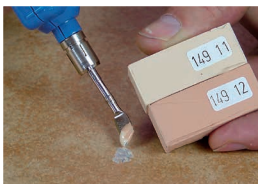
2 Topienie wypełniaczy

Uszkodzone miejsce musi być czyste, suche oraz odtłuszczone. Usunąć ewentualne luźne odłamki.