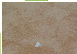
1 Przygotowanie powierzchni