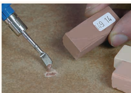
5 Korekta koloru

Nadmiar wypełniacza usunąć ostro karbowaną stroną szpachelki.