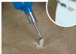
3 Nanoszenie wypełniacza

Przyrząd uruchomić według instrukcji z poprzedniej strony. Rozgrzaną końcówkę przyłożyć do wypełniacza CERAMIX® o odpowiednim kolorze i roztopić wymaganą ilość. Można zmieszać kilka kolorów wypełniacza (foto 5).