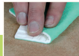
11 Dopasowanie stopnia połysku

Miejsce retuszu zabezpieczyć lakierem bezbarwnym używając korektora LAKFIX®. Lakierować równomiernie, w jednym kierunku.