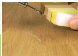
3 Topienie i mieszanie wypełniaczy

Dopasować odpowiedni odcień wypełniacza DREWMIX. Rozpocząć retusz od najjaśniejszego koloru.