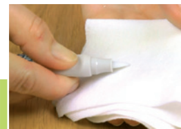
9 Odpowietrzanie korektora

Przed użyciem wstrząsać korektor LAK-FIX AQUA przez ok. 15 sekund w celu wymieszania lakieru. Kulki wewnątrz korektora muszą być słyszalne. Po tej czynności ściągnąć nakrętkę.