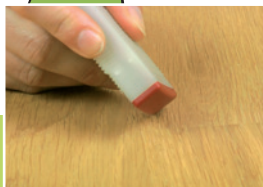
1 Przygotowanie powierzchni