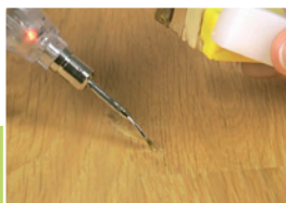
4 Wypełnianie ubytku

Ściągnąć końcówkę z pędzelkiem – tak jak pokazano na zdjęciu i nacisnąć ostrożnie w miejscu oznaczonym „PRESS”. Uwolnienie ciśnienia z wnętrza korektora spowoduje jego odpowietrzenie. Po tej czynności ponownie nałożyć końcówkę z pędzelkiem.