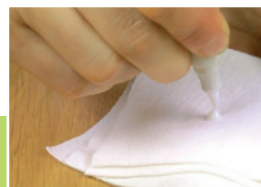
10 Aktywacja korektora

W celu odtworzenia struktury drewna ciemnym wypełniaczem imitować słoje. Po tej czynności, nadmiar wosku usunąć łagodnie karbowaną stroną szpachelki.