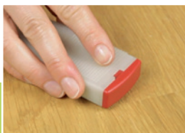
5 Wyrównanie powierzchni

Nałożyć wypełniacz w miejsce uszkodzone z lekkim naddatkiem.