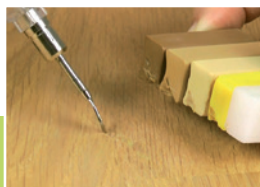
6 Retusz końcowy

Nadmiar wypełniacza usunąć ostro karbowaną stroną szpachelki.