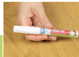
8 Przygotowanie korektora

Pozostałości wypełniacza zeszlifować papierem ściernym rozpoczynając od ziarnistości 150, następnie zmienić na papier o ziarnistości 240. Wskazówka: szlifować ostrożnie, lekko przyciskając do powierzchni.