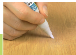
11 Zabezpieczenie powierzchni

Korektor LAKFIX® AQUA przytrzymać nad trykotem w pozycji końcówką w dół, a następnie w miejscu oznaczonym napisem „PRESS” lekko naciskając spowodować otwarcie wentyla, umożliwiając tym samym spłynięcie lakieru do końcówki. Końcówkę korektora lekko osuszyć przy pomocy trykotu, a następnie wykonać retusz.