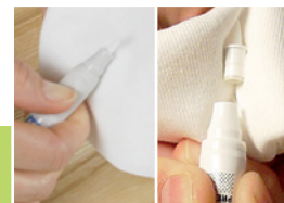
9 Odpowietrzanie korektora

Przed użyciem wstrząsając korektor LAKFIX AQUA przez ok. 30 sekund w celu wymieszania lakieru. Kulki wewnątrz korektora muszą być słyszalne. Po tej czynności ściągnąć nakrętkę.