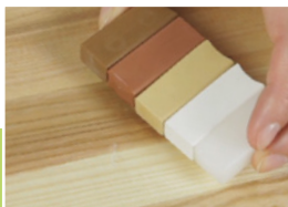
2 Wybór koloru

Uszkodzone miejsce musi być czyste, suche oraz odtuszczone. Usunąć ewentualne luźne odłamki.