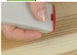
1 Przygotowanie powierzchni