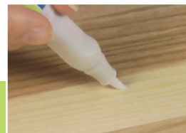
11 Zabezpieczanie powierzchni

Korektor LAKFIX® AQUA przytrzymać nad trykotem w pozycji końcówką w dół, a następnie w miejscu oznaczonym napisem „P/PRESS” lekko naciskając spowodować otwarcie wentyla, umożliwiając tym samym spłynięcie lakieru do końcówki. Końcówkę korektora lekko osuszyć przy pomocy trykotu, a następnie wykonać retusz.