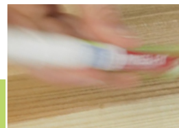
8 Przygotowanie korektora

Powierzchnię odtuszczyć za pomocą włókna szarego. Pocieranie włóknem powoduje również zmatowienie miejsca retuszowanego.