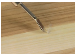
4 Wypełnianie ubytku

Ściągnąć końcówkę z pędzelkiem - tak jak pokazano na zdjęciu i nacisnąć ostrożnie w miejscu oznaczonym „P/PRESS”. Uwolnienie ciśnienia z wnętrza korektora spowoduje jego odpowietrzenie. Po tej czynności ponownie nałożyć końcówkę z pędzelkiem.