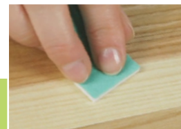
12 Dopasowanie stopnia połysku

Miejsce retuszu zabezpieczyć lakierem bezbarwnym używając korektora LAKFIX AQUA. Lakierować równomiernie w jednym kierunku. Po użyciu umyć końcówkę z pędzelkiem i wysuszyć.