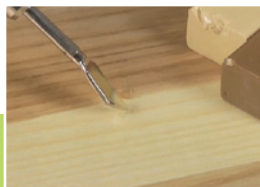
6 Retusz końcowy

Nadmiar wypełniacza usunąć ostro karbowaną stroną szpachelki.