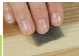
7 Odtuszczenie powierzchni

Przyrząd uruchomić według instrukcji z poprzedniej strony. Grot urządzenia do topienia wypełniacza natychmiast się nagrzewa. Roztopiać małe porcje wypełniacza i mieszać je.