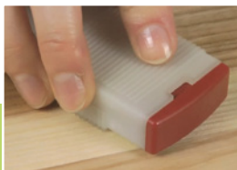
5 Wyrównanie powierzchni

Nałożyć wypełniacz w miejsce uszkodzone z lekkim naddatkiem.